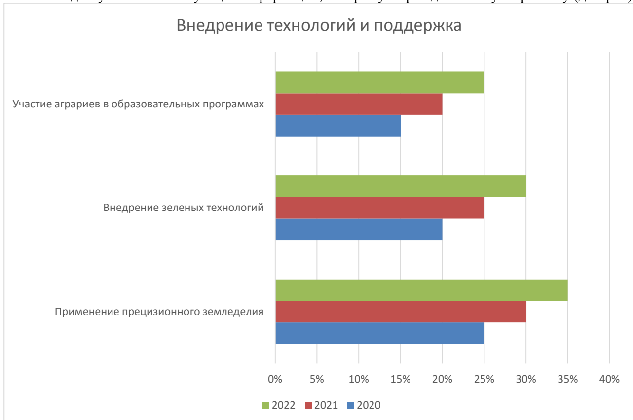
Диаграмма 2. Внедрение технологий и поддержка

Потребуется обучение фермеров, чтобы они понимали важность экологических стандартов и устойчивого ведения сельского хозяйства. Кроме того, необходимо не только теоретически, но и практически обучать фермеров новым технологиям и бизнес-процессам. Если фермеры не найдут способов использовать устойчивые методы, то все усилия по соблюдению требований будут напрасными. Поэтому существует необходимость в образовательных курсах и тренингах, направленных на то, чтобы помочь фермерам углубить свои знания в области устойчивого ведения сельского хозяйства. Основные усилия в этом отношении должны быть направлены на привлечение экспертов и самих фермеров к изучению альтернативных методов ведения сельского хозяйства, которые могли бы соответствовать современным экологическим стандартам. Это не только даст им возможность узнать больше, но и найти практическое применение своему опыту. В этом отношении роль цифровых платформ весьма актуальна. В таком случае это стало бы простым способом распространения информации о новейших технологиях и методах, способствующих созданию экологически чистого сельского хозяйства. Онлайн-курсы, вебинары, семинарские занятия для фермеров, удобные домашние курсы, на которых практические знания передаются не выходя из дома, что также значительно облегчают доступ к соответствующей информации, которая ускорит дальнейшую практику (диагр. 2).