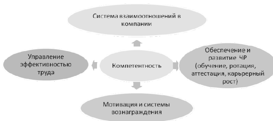
Рисунок 2. Компетентность как фундаментальное понятие, связывающее все элементы подсистемы активизации человеческих ресурсов (составлено авторами)

Структура компетентности, составляющие её элементы являются интегрирующим звеном для всех блоков активизации человеческих ресурсов (рис. 2).