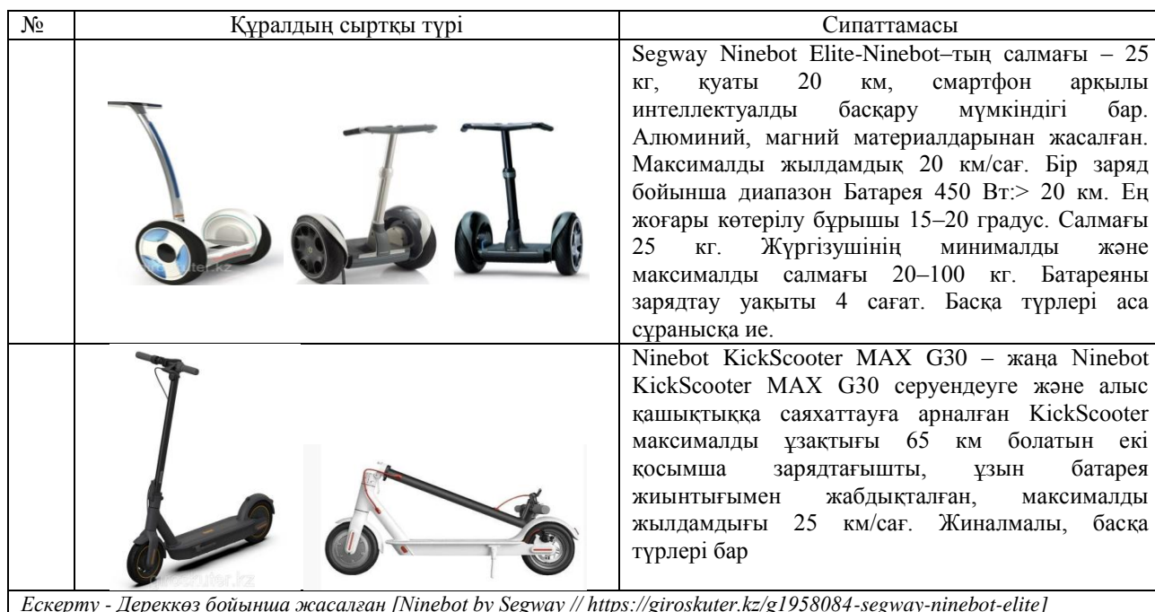
Кесте 1. Segway–дің сыртқы түрі