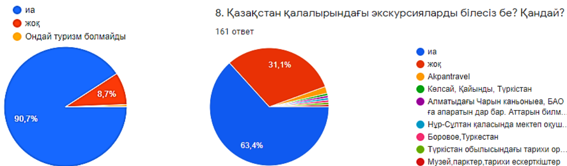
1-сурет. «Қазақстандағы экскурсиялық қызметті білу» сұрақтарының жауап нәтижелері

Негізгі сауалнамаға барлығы 61 адам, 17-18 жас аралығындағы, қыздар, студент жастар жауап берген. Сұрақтар экскурсиялық қызметке байланысты қойылды, соның бірі Қазақстандағы экскурсиялық қызмет туралы білесіз бе? Жауаптардың 90,7% қанағаттарлық жауап берсе, 8,7% білмейтіндігін көрсеткен және соның 69% адам Қазақстанның қалаларындағы ұйымдастырылатын экскурсиялардан хабардар екендігін көрсеткен (1-сурет).