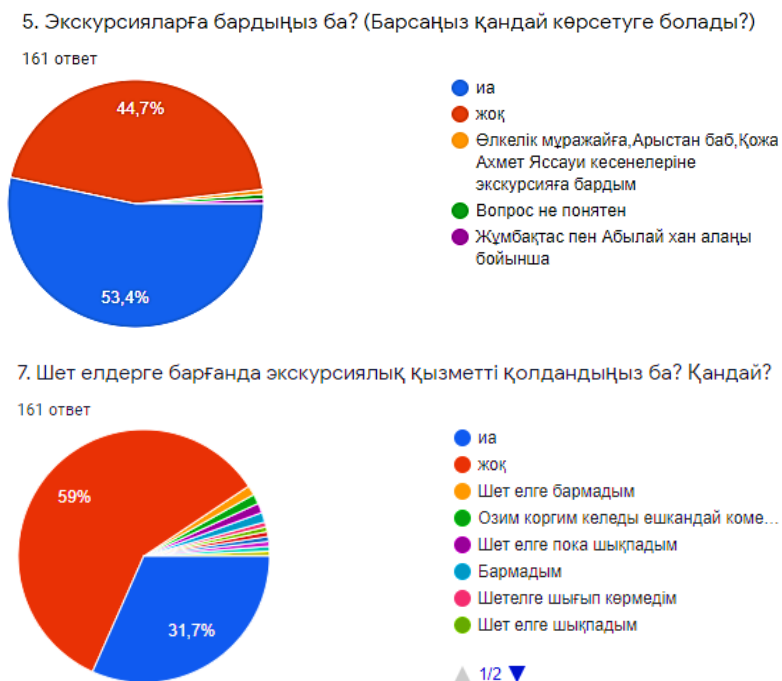
2-сурет. «Отандық және шетелдік экскурсиялық қызметті қолдану» сұрақтарының жауап нәтижелері

Жауап берушілер экскурсиялар туралы білсе де, оларды көпшілігі қолданбаған, 161 адамның 44,7%, яғни 72 адам экскурсияға бармаған және мөлшермен 40% адам, оның 31,7% жоқ деп нақты жауап берсе, 59% шет елдегі экскурсиялық қызметті қолданған және қалған 8% шет елге бармағандығын көрсеткен (2-сурет).