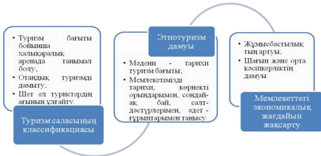
1-сурет. ҚР этнотуризм саласының даму сипаттамасы

Сонымен қатар, этнотуризмді дамыту арқылы, біз мемлекетіміздің түкпірлерінде орналасқан, тарихы мол, әдет-ғұрыптарға, дәстүрлерге бай мекендермен ғана таныстыра қоймай, сонымен сол аймақтарда тұратын жастарды жұмыспен қамтуға мүмкіндік бере аламыз.