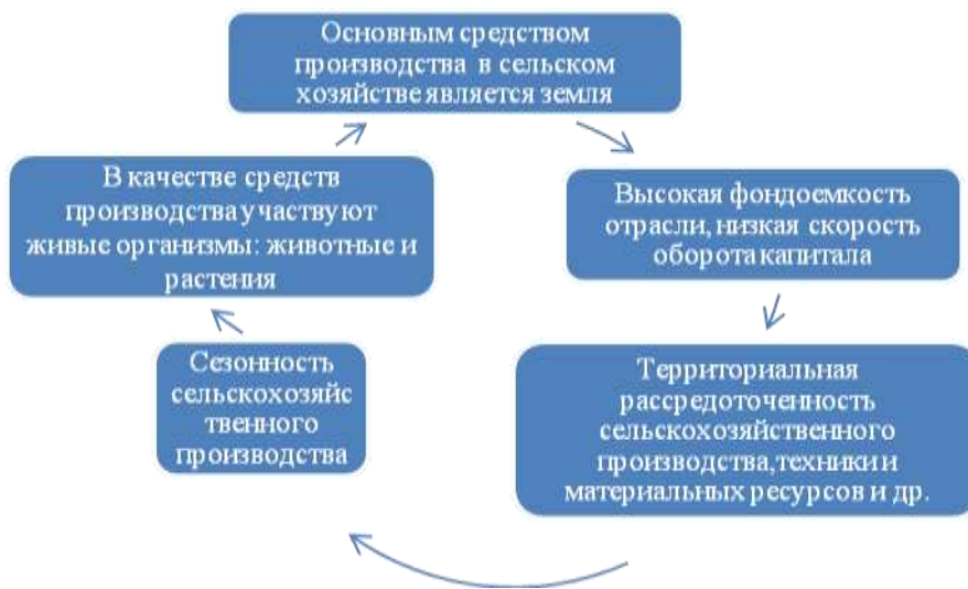
Рисунок 1. Специфические особенности сельского хозяйства*

На рисунке 1 наглядно отражены специфические особенности сельского хозяйства.