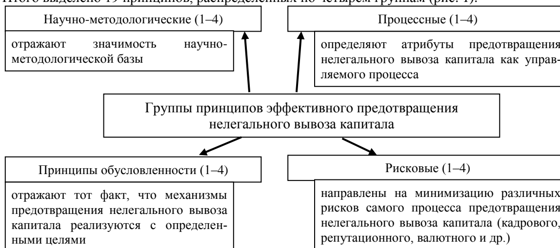
Рисунок 1 — Классификационные признаки групп принципов предотвращения нелегального вывоза капитала Примечание — авторская интерпретация условий успешного предотвращения нелегального вывоза капитала

Итого выделено 19 принципов, распределенных по четырем группам (рис. 1).